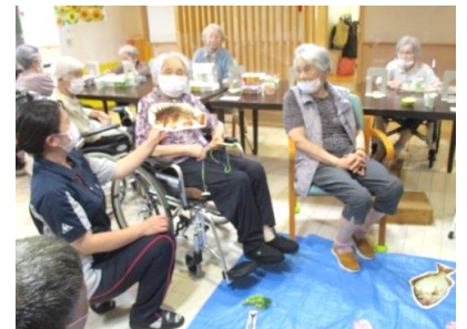
写真左は習字、右上は魚釣りゲームのもようです。